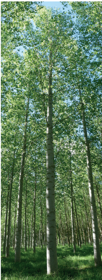
Aspecto de la copa