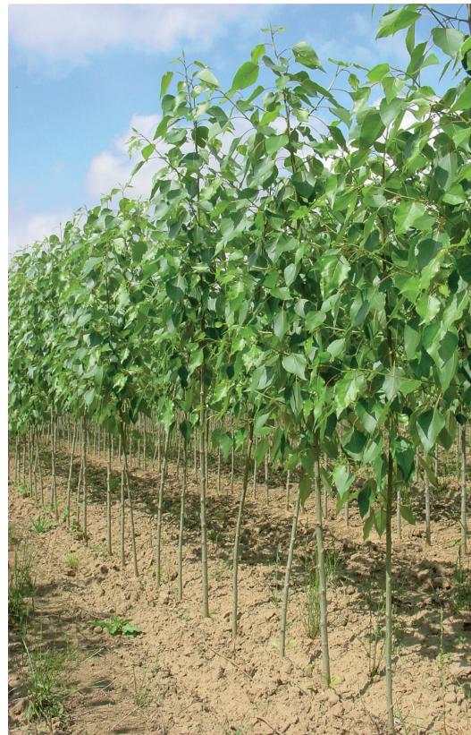
Plantas de 1 er año en vivero