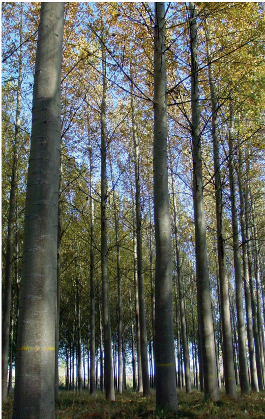
Chopera de 'Unal'